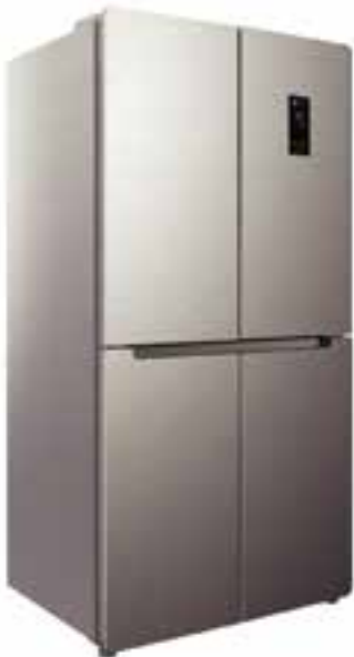
מקרר נירוסטה 4 דלתות רוחב 120 ס"מ