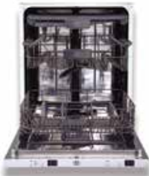
מדיח אינטגרלי מלא