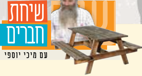
עם מיני יוספי

למשנית לב האפצ'ים, גם אחרי נפילה מגובה אדיר, הכספת לא נפגעה. מתוסכלים לחלוטין, הם נכנעו ופלטו נטל את הכספת היקרה, בלתי שאלו הם זרקו אותה.