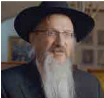
הוא אפילו לא הבין מה הוא אומר. השליח הרב לאזאר