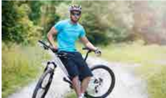
הבחירה החופשית זהו יסוד התורה כולה

מבטלת לו את הבחירה החופשית, להיפך, היא מגדילה אותה. שיתפתי את חבריי הדתיים במניין בכירור החשוב הזה שעשיתי, ואז פניתי לבחור שמדבר לפני תפילת הנעילה וביקשתי ממנו, שבניגוד לשנים קודמות בהם הוא מביא בעיקר רק סיפורים שמעוררים את הלב, שהפעם ידבר קצת על שמירת מצוות וייתן דוגמאות, החבר לא שמע לעצתי, ופניתי אליו בסיום הצום ואמרתי לו "אתה מדבר מאוד מרשים ובצורה מאוד מעוררת השראה, אבל דע לך, שאחרי 120 שנה, האנשים היקרים כאן יגיעו לעולם הבא וישאלו אותם למה הם לא שמרו שבת והם יגידו לקב"ה: כל שנה ביום הכיפורים מגיעים אלינו תלמידי ישיבה והם אף פעם לא אמרו לנו שיש איסורי שבת, אז מאיפה אנחנו צריכים לדעת?"