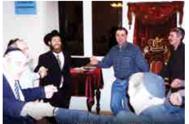
הרב זקלס בריקוד עם יהודי נובוסיבירסק בביקורו הראשון בעיר

וגורמים לנו לומר לעצמנו: אתה יודע מה, אם מלחמה - אז בא נילחם! בדרך שלנו, באמצעות אור תורה. אם יש אנשים שנלחמים בנו, אנשים שלא רוצים אותנו כאן, זה רק מראה כמה חשוב שנהיה כאן. בין אם מדובר באנטישמיות ובין אם בקשיים אחרים. זו בעצם קריאת השכמה שאומרת לנו כמה חיוני להיות שם."