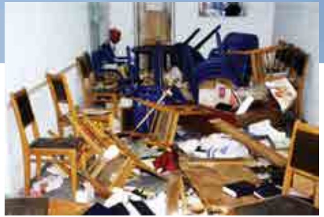
הפגורום בבית הכנסת שגרם למהפך