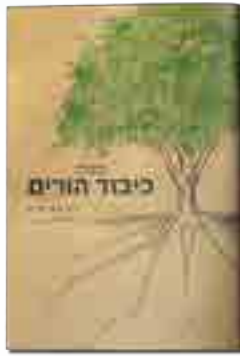
מצות כיבוד הורים כל מה שעובר בין הורים לילדים