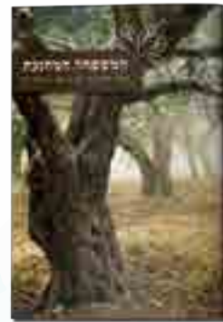
המשפחה המחנכת איך (לא) מחנכים ילדים