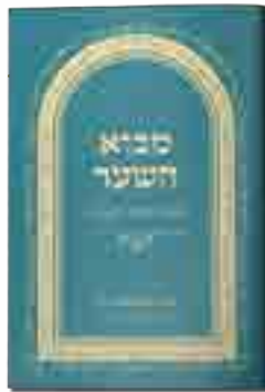
מבוא השער התבוננות ב"שער היחוד והאמונה" לאדמו"ר הזקן