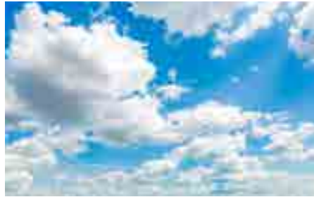
האם אדם שערך החירות עליון בעיניו יכול לפגוע באחרים?

להיות קשור לעם ישראל, להאמין שהוא חלק מקולקטיב לאומי שיש לו צביון. הדבר מביא לאהבה לעם ואהבה לכלל יהודי ויהודי. אידיאל זה שונה מהפשיזם, משום שהפשיזם מוחק לעיתים את הפרט וגם מוחק לעיתים תרבויות אחרות, אך הלאומיות הישראלית גם מכבדת את הפרטים באומה וגם מכבדת עמים אחרים ורוצה להיטיב להם. רק אחרי שלבים אלו אדם יכול להאמין את ה' בצורה בריאה ולקיים מצוות באופן שלם.