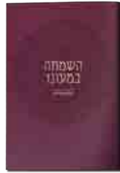
השמחה במעונו השראת שכנה בבית