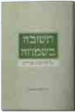
תשובה בשמחה על קדושת הברית

צוללים לעבודת הנפש עם מאמרי יסוד מאת הרב יצחק שפירא שמירת הברית, זוגיות, חינוך ילדים, כיבוד הורים ועוד.