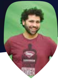
בהנחיית: מתן צור

יום שני כ"ה אדר ב' /// היכל התרבות יד בנימין. בנות - 09:00 // בניים - 11:00