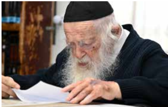
"הרבה דברים מתבהרים בכניסה לביתו ברחוב רשב"ם"

כנפיים, כך ישראל אינם יכולים לעשות דבר חוץ מזקניהם". ולכאורה עולה שאלה- הנה אנו רואים איך הכלכלה פורחת והביטחון עובד וכל זה מבלי גדולי ישראל, אז מה כוונת המדרש? הרב קוק מסביר שם שכאשר הרוח מתמוטטת אדם עלול להתייחס לחייו בצורה מכנית, ולשכוח את הנשמה שלו. כך גם עם ישראל עלול לשכוח את הייעוד שלו - שהוא ממלכת כהנים וגוי קדוש, וחלילה מסוגל להתדרדר לשפלות גדולה מאוד. אז מה יעשה עם ששוכח את ייעודו? "עת אשר יתקפו הייאוש ויאמר יעקב אולי זה גורלו, ללכת על גחון וללחך עפר, ישא ישראל עיניו, אל הזקנים שבדור - יראה הוד נפשם ורוממות שאיפותיהם, מהם יכיר את רוחו, כי רוח האומה יתגלה בגדוליה, אז יכיר את תוכן חייו ורוח חיים חדשים, חיים של קדושה ועדינות רוח ימלאוהו".