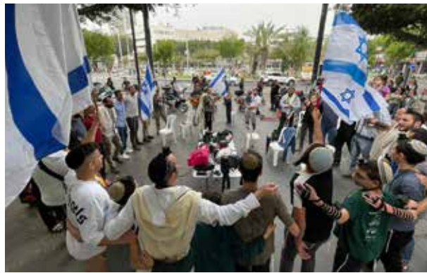
מדהים איזו השפעה יש לאנשי אמונה בעיתות משבר