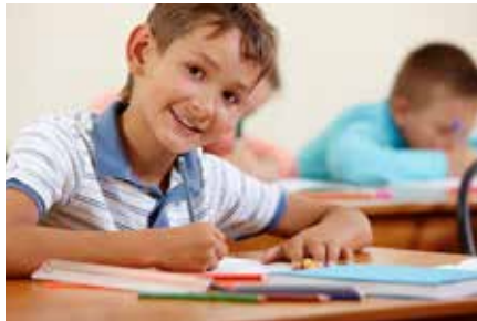
הייתי התוצר של מערכת החינוך הממלכתית