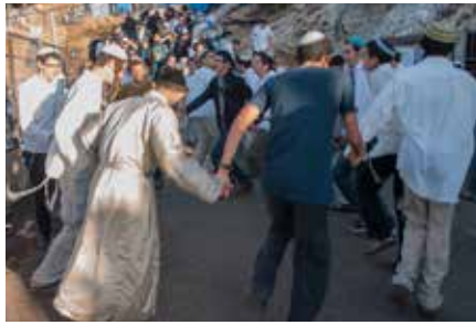
תלמידי הישיבה עם התחפשות השפיעו עליי