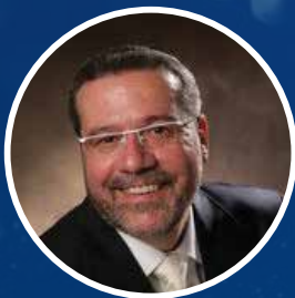
הזמר החסידי ישראל פרנס

13:00 - 10:00 יום עיון ב'בית אורות' 16:30 - 13:00 סיורים מודרכים ומרתקים במרחבי הר הזיתים - הסיורים יצאו ממלון 'שבע הקשתות' מול מצפה רחבעם 16:30 למיטיבי לכת - סיור רגלי עם דגלי ישראל, דרך מעלה הכוהנים לכותל המערבי