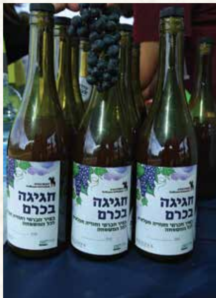
הבקבוקים של התירוש הקדוש שמחולקים לציבור במסגרת הבציר