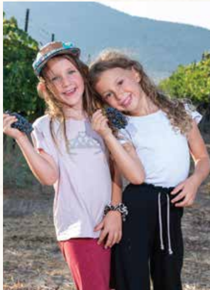
חיובי הילדים בבציר אומרים הכל - חוויה משפחתית המבוססת על ערכי השמיטה

בתקופת החופש, נותרו החקלאים עם עודפים גדולים של יבול. על מנת לדאוג לפירות ולחקלאים, יצאה העמותה במיזם,