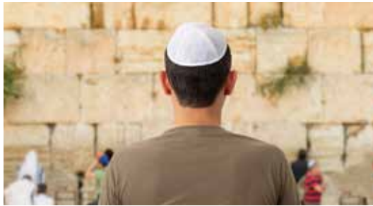
אולי הם מקרבים אותך אליהם

קירוב נכון? גם יש מצווה להפיג צער של יודי, במיוחד שרגשות זה דבר חשוב בימינו. אך חז"ל במסכת סוטה אמרו "באותה שעה נתחייבו שונאיהן של ישראל (עם ישראל' בלשון יפה) כליה" שהחניפו לאגריפס. אני חושב שזה קשור לכניעה לאליטה שכתבתי כאן, ברור שהיו להם הרבה פלפולים הלכתיים לעשות זאת, אבל כנראה הם הרגישו צורך עז להחניף לו ומשם הכל נבע. ספר היראים מוסיף שם שאפילו בשתיקה נקרא חנף. כלומר