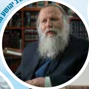
הרב יוסף שוורץ - הסבא קדישא ממתינה