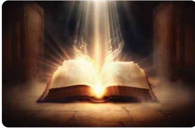
הציבור הישראלי צמא לתורה ואנחנו מבינים זאת באיחור

אבל כתב ספר מוסר שגם אדם פשוט יכול להבין. לא מעט חילונים שואלים אותי בצבא "למה אסור לאכול בשר וחלב, אבל מותר שניצל עם ביצה?" כנראה מישהו הסביר להם איזה טעם מסויים במצווה והם הפכו את זה ל"בניין אב". אז אני מתחיל להסביר להם שיש תורה שבכתב ותורה שבעל פה, ושאיך שום אפשרות להבין את התורה שבכתב בלי המסורת, כי ספר התורה בכלל לא מנוקד, ואיך יודעים איך לקרוא אותו ואת צורת האותיות? להרבה מהם הדברים הפשוטים האלו הם חידוש גדול! כנראה רוב הדתיים שהם שוחחו איתם מיד