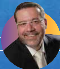
ישראל פרנס הזמר החסידי