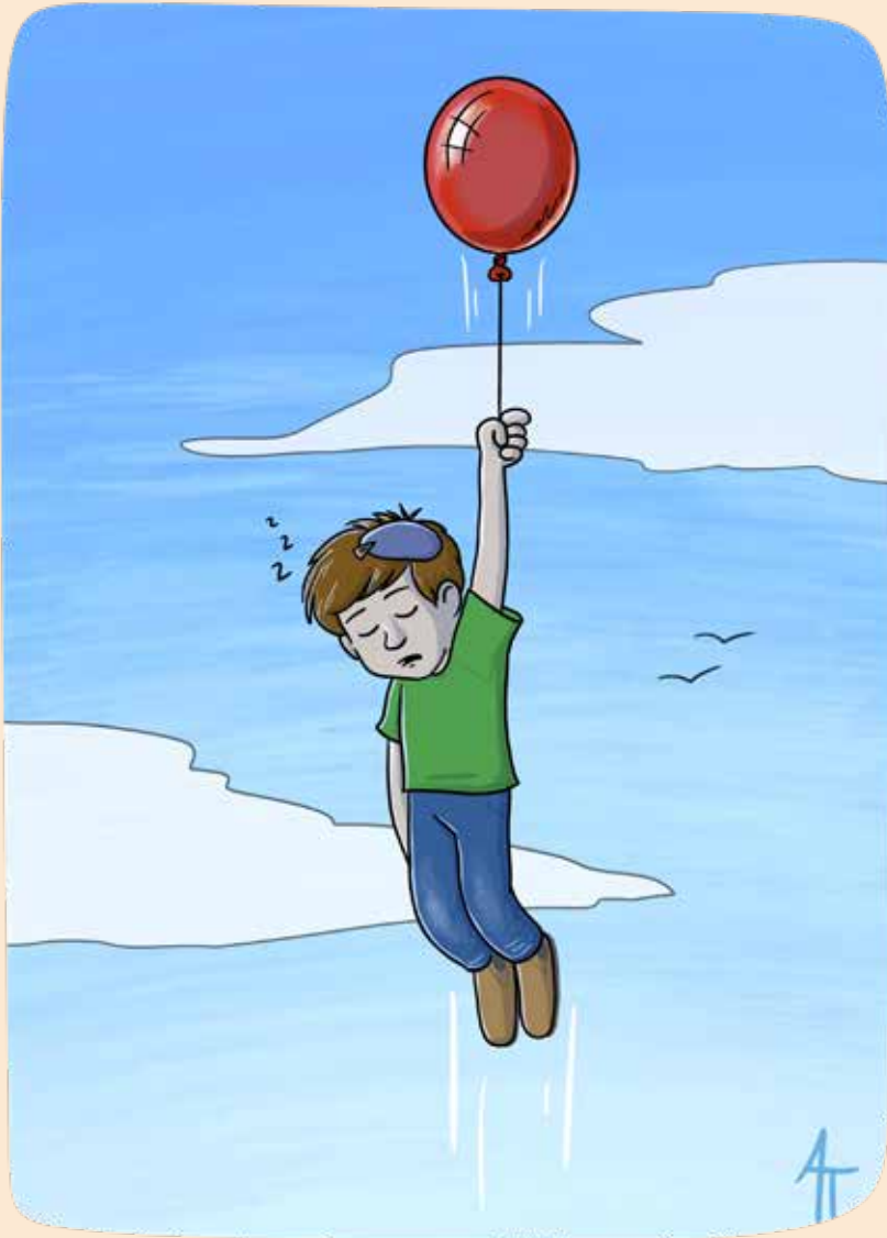
איור: אהרון טירם

אבל אני כן רוצה קשר אבא, אני רוצה להיות יכול לפגוש אותך דרך כל ההתמודדויות האלו של היום-יום, דרך כל הניסיונות, דרך התורה והמצוות שלך. הכי הייתי רוצה להצליח להיפגש בכל דבר שאני עושה, גם הקטן ביותר. בפועל להיות שם רחוק ממני כרגע, אבל לפחות בהזדמנויות ששתלת לי כאן אני רוצה לא לפספס. להצליח