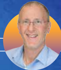
הרב ליאו די ששכל את רעייתו לוסי ובנותיו מאיה ורינה הי"ד