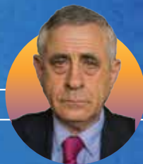
ד"ר מרדכי קידר מזרחן ומרצה