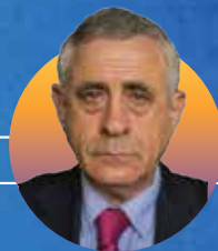
ד"ר מרדכי קידר מזרחן ומרצה