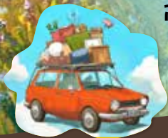
ציור: יהושע יוסמן

ד"ש מהצפון שיראל, מפונה מתמודדת, כותבת לעם ישראל