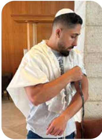
תופעה שתופסת תאוצה

התעוררות הרצון להתקרב לה' יתברך מאוד נוכחת בחודש הזה, גם בהנחת תפילין, לבישת ציצית, הדלקת נרות שבת ועוד. למסורתיים יש חיישנים רוחניים שקולטים את הרוח שיש בחודש הזה, זה לא נמצא בפולטים שכליים אלא באינטואיציה היהודית. עלינו להקשיב לאינטואיציה היהודית של המסורתיים ולחבר אותם לקיום מלא של תורה ומצוות. אז בואו נארגן סיור סליחות בשכונה שלנו או במקום העבודה, נסיעה לקברי צדיקים עם שיעורי תורה, או נציע לחבר בלימודים שרוצה להניח תפילין. בנוסף, עלינו גם לפתח אינטואיציה כזו בתוכנו, של "בנים אתם לה' אלוקיכם", ומתוך כך גישה של יחס בריא לימים הנוראים. שנוכח.