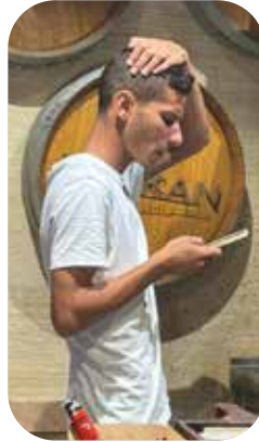
מי שלא שם לא קיים, סליחות התשפ"ד

וכאן אנחנו מגיעים לנקודה המרכזית. כל מי שתורם לארגוני התשובה, כל הכבוד לו, הוא שותף אמיתי בגאולה של הדור, אבל זה לא מספיק. כל יהודי צריך לשאול את עצמו איך הוא מקרב בעצמו יהודים לתורה, לא רק על ידי תרומה כספית (שזה דבר מאוד חשוב), אלא במעשה ממש. וכל אחד ואחת יכולים לעשות זאת, "כי קרוב אליך הדבר מאד בפיך ובלבבך לעשותו".