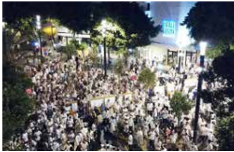
איך עושים שלום?

השלום והאחדות אלו מושגים מאוד עליונים וחשובים. כל התפילות שלנו מסתיימות בבקשת השלום. שלום זוהי תנועת הנפש והשאיפה של כל יהודי באשר הוא, תמיד חשוב לדבר על שלום, ובעיקר בעיתות מלחמה בה העם חייב להיות מאוחד כדי לנצח. דווקא בגלל חשיבות העניין חייבים לברר אותו בשכל. במיוחד כאשר לצערנו כל מיני גורמים פוליטיים מנצלים אותו על יהודים תמימים על ידי הפעלת מניפולציות רגשיות, כאילו כל מי שחושב אחרת הוא פוגע באחדות ובשלום.