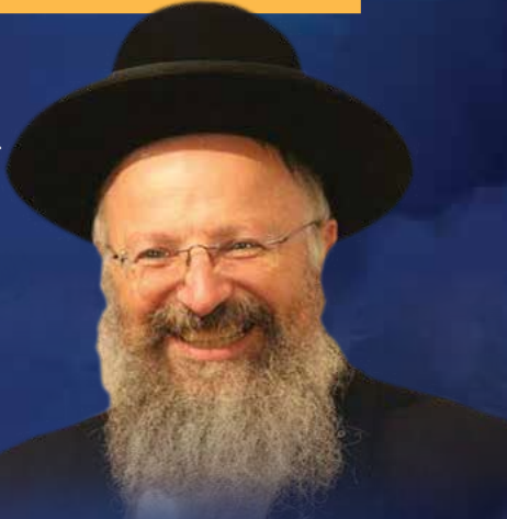
הרב שמואל אליהו רב העיר צפת