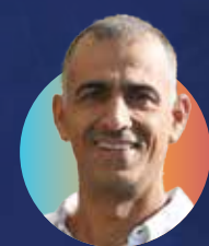
אל"מ במיל' חזי נחמה ממייסדי פורום המפקדים והלוחמים במילואים