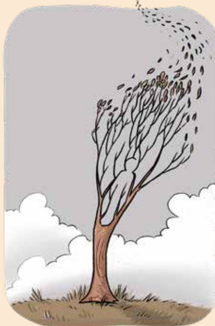
ציור: אהרן טירם

אבל רק לדעת שיש דבר כזה בעולם מאפשר לנו, שוכני העמקים, לנשום אוויר מסוג שונה – אוויר פסגות.