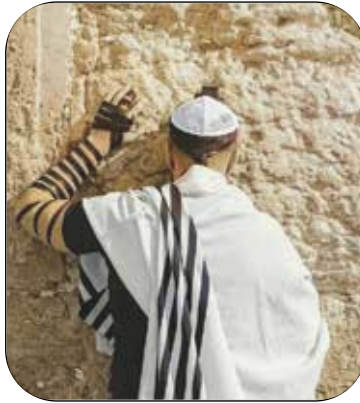
הדתה או גאולה?

וכמובן, יש שם תלונה של תלמיד שטוען מה קורה למי שמסרב להניח תפילין "חוטפים הטורדות וקללות מצד אלה שמפעילים את הדוכנים. המורים לא מתערבים. בית הספר הפך למקום מאיים. למה אני צריך להרגיש שאני לא בסדר אם אני לא מניח תפילין?" כאן צריך לזהות את המניפולציה הפרוגרסיבית. כדי להחליף את המרחב הציבורי למקום חסר זהות, השמאל תמיד משתמש בטענות של מיעוטים מדוכאים, תוך שימוש בשיח של רגשות אנשים שנפגעים. לשיטתם, בגלל שיש פגיעה ברגשות אז אסור להגיד 'אבא ואמא', כי יש אנשים שיש להם אבא ואבא, ואסור להגיד שמירת שבת כי יש אנשים שלא שומרים שבת, ואסור להציע להניח תפילין בבית הספר, כי יש אנשים שלא מניחים תפילין. דתיים נאיביים שלא מבינים את המניפולציה הזו שלקוחה מבית מדרשו של קרל מרקס, נופלים בפח הזה ומשתפים פעולה. כמובן שלא תשמעו טענות כאלו נגד התוכן החילוני-פרוגרסיבי שמונגש בבתי הספר הממלכתיים- זה בגדר חופש הביטוי והפלורליזם.