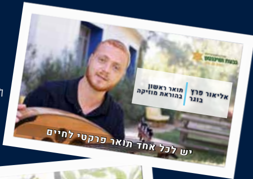
יש לכל אחד תואר פרקטי לחיים

לצפייה בסרטון המלא על החוויה בגבעת סרקו את הקוד