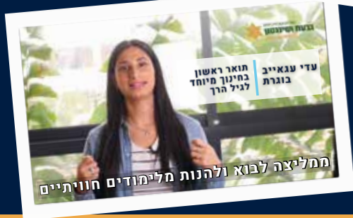
מחליצה לבוא ולהנות מלימודים חוויתיים