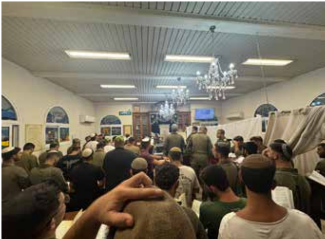
באלול גם האשכנזים רוצים להיות מסורתיים

במהלך היום עברתי בין הלוחמים, והזכרתי למי שמעוניין שיש בלילה סליחות, התחלתי לשיר לידם "בן אדם מה לך נרדם" והם המשיכו לשיר יחד איתי.