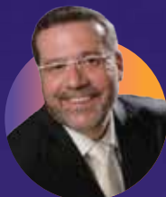
ישראל כרונ הזמר החסידי, שיביא סיפורים בלעדיים מחצרות האדמו"רים