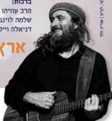
הפקה: רחל הורביץ, עטילה בר-טור, עדיה טמנגה טוהר סילבר, לירון | אורית הלר