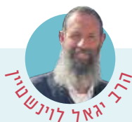
הרב יגאל לוינשטיין