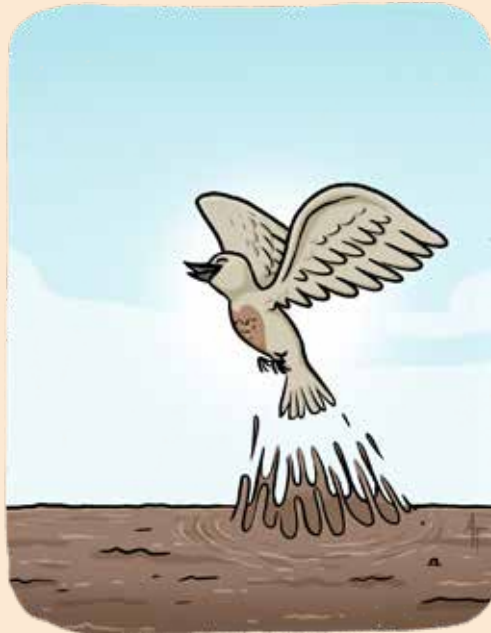
איור: אהרון טירם

כולכם עברתם מסלולי הכשרה פסיכיים ביחידות שלכם בצבא, מסלולים שלקחו אתכם מעבר לקצה גבול היכולת, אבל ברור לכם שמה שעברתם עד עכשיו הוא משחק ילדים ליד מה שאתם הולכים