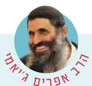
הרב אפרים ג'יאמי