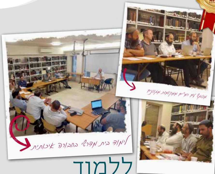
מנכ"ל רמ"ם מניקומות מיליוני