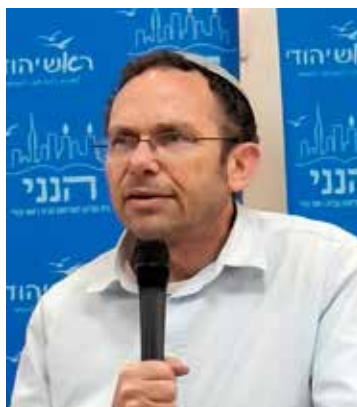
מי שפועל עם אל מרוויח

סוגיית התשובה היא כבר לא תחום של יחידי סגולה, ההתעוררות הלאומית מחייבת אותנו להבין שזה הנושא של הדור ולהכשיר את עצמנו לפעול בתחום. כל הפועל עם אל בגאולה הרוחנית מקדם את אותנו אל הגאולה השלמה ואל משיח צדקנו. אני מזמין אתכם לבוא להרצאות המרתקות, לשאול שאלות, לחשוב ביחד איך מתקדמים ומקדמים את עם ישראל ליעודו האלוקי. אני מבטיח לכם שמי שיתחיל לעסוק בקירוב יראה סייעתא דשמיא מאוד גדולה בתחום, כי ברגע שמצטרפים לקב"ה בתהליך היסטורי, הוא מסייע, וכל אדם פרטי הופך לאדם כללי. כל יהודי שמקרבם אותו לעבודת הבורא זה לא הזיכוי הפרטי שלו בלבד אלא גם כל צאצאיו שילכו בדרך התורה והמצוות. שנזכה.