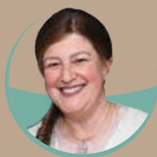
הרבנית ברכה שילת