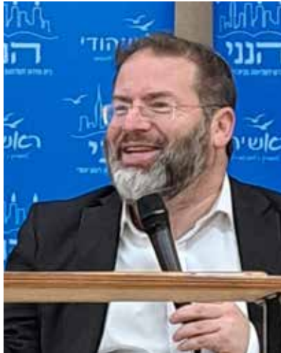
אם אתה מתוון נדל"ן רוחני זכית!

מידי פעם הקוראים של המדור שולחים לי תגובות לדוא"ל. אני משתדל לענות לכולם. אך לפעמים זה באיחור בגלל תקופת המילואים. רציתי לשתף כאן בתגובה שנשלחה אליי בתקופת הסליחות. "שלום וברכה. אני קורא אדוק של הפינה שלך "עכשיו תורנו" בעלון "קרוב אליך", ומתחבר למרבית הדברים שהרב כותב שם. חשבתי שתשמח לשמוע, שהדברים מחלחלים.