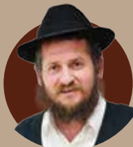
הרב משה שילת