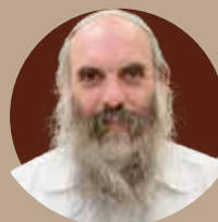
הרב יהושע שפירא