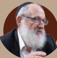
הרב שניאור זלמן גופין