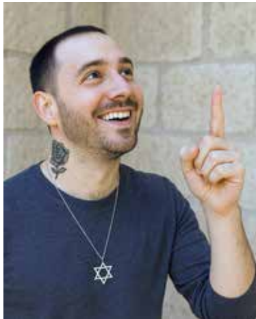
האם פרויקט 929 מקדם או מקלקל את עם ישראל?

כאן חשוב להדגיש שהעובדה שהיהדות שייכת לכל יהודי, לא אומרת שכל יהודי יכול לפרש אותה כדעתו. מסורת ישראל והתורה הקדושה הן לא פלסטלינה שאפשר לעצב אותן איך שבא לי. לכן כל מיני מיזמים כמו 929 מסלפים ומעקמים את מסורת ישראל משום שחלק מהכותבים אינם מחוייבים לה, ויש שם גם כופרים גמורים שלא מאמינים בקדושת התורה, אלא מתייחסים אליה כמו לטקסט ספרותי. התורה היא מן השמיים, ופרשנותה עוברת בתורה שבעל פה, זהו גם עיקר חשוב בהסברת התורה. הרבה פעמים שואלים "למה הרבנים ממציאים פרשנויות" ולכן ראשית לכל צריך להסביר שהתורה שבכתב הגיעה יחד עם התורה שבעל פה. רק אחרי שמבינים את זה, אפשר להסביר את חשיבות תפקיד הרבנים בדורנו. פעם שמעתי מהרב צוקרמן זצ"ל: "אנחנו לא עובדים את הרבנים אלא את ה' יתברך ורוצים לעשות את רצונו, אלא שהרבנים מסבירים לנו מהו רצון ה'". בניגוד לתפיסה הנלמדת באקדמיה כאילו רבנים מחפשים שליטה, חלילה - המבט הוא קודם כל פנימי, תבקש לדעת את רצון ה', ואז תחפש לך רב, כי צריך מסורת כדי לדעת מהו רצון ה' והדרך לעבוד אותו. עלינו להסתכל על היהודי הניצב מולנו לא כעל 'חילוני' מנוכר ליהדות ושונא דת (כמובן שיש יוצאי דופן שהם באמת כאלה), אלא כאל יהודי שמחפש משמעות, שהנשמה שבקרבנו מתגעגעת למשהו נשגב, והקב"ה מעורר בו הרהורי תשובה. הוא מחפש את הזהות שלו והוא זקוק שיגידו לו שהתורה שייכת לו. הגישה הזו הופכת אותנו לאנשים שנותנים מענה ולא כמו שמנסים לצייר זאת כ'הדתה וכפייה דתית'. בדיוק כמו שנותנים ארוחה לאורח, כי יודעים שהוא שיש לו צרכים גשמיים, כך לכל יהודי יש צרכים רוחניים. שימו לב אל הנשמה.