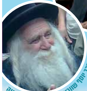
הרב יוסף שוורץ - הסבא קדישא מנחיה