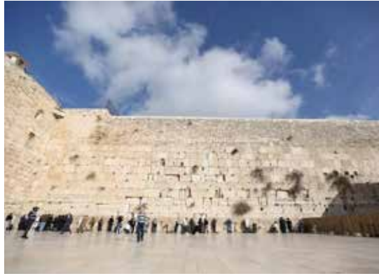
תיקון החורבן מתחיל מלימוד המורשת

הובילה למצוקה זהותית של יהודים רבים בעם ישראל, מדובר בפשע היסטורי, לא פחות. אך התורה "לא תשכח מפי זרעו", כי היא כתובה על קלף נשמתנו. ועכשיו, בעת הקץ ותחיית הקדוש היהודים יתבעו את מה שנלקח מהם, את מה שחמסו מהם כל מיני בעלי אינטרסים ואג'נדות. מתעורר כאן מרד קדוש שלא מגיע מהרבנים או מארגונים דתיים, אלא מהמגזר החילוני והמסורתי - הם מורדים בכפירה ובבורות, הם מתחברים מחדש לנשמתם וזהותם בבחירה חופשית. והם לא מתנצלים כמו דתיים מסויימים, יש להם עזות דקדושה אותה הם למדו מהחילונים. הם רוצים כאן מדינה יהודית, מדינה שמחוברת למסורת, בתי ספר עם