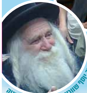
הרב יוסף שורץ - הסבא קדישא מנחיה