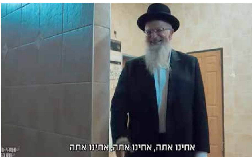
אחינו אתה, אחינו אתה, אחינו אתה

“ברגע שהדמות הסכימה להיחשף, אלחנן הציע שאכנס לסיפור ואתחיל לתעד”, מביא אברהם את הסיפור מהצד שלו. “לא היה לנו מושג לאן אנחנו נכנסים ולאיזה ממדים זה יגיע, אבל הבנו מהרגע הראשון שמדובר בסיפור חשוב ויוצא דופן. הרגשנו מחוייבים לעשות כל מה שניתן כדי שכל יהודי ויהודייה ידעו על הסכנה הזאת. השקענו בלי חשבון מתוך אמונה שזה התפקיד שלנו, ושיש סיבה לכך שהקב”ה גלגל אלינו את הסיפור הזה. סוגיית ההתאסלמות קיימת שנים רבות