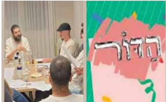
איזה דור אנחנו באמת?

אז מהו זה? הוא אצל החלוצים בבניין הגוף והאומה, מתגלה כעת אצל "חלוצי הרוח". אם אז