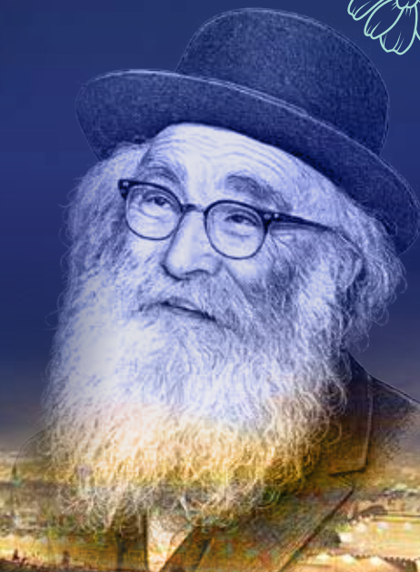
איש צדיק היה 57 שנים לפטירתו של הרב אריה לוין זצ"ל רב אסירי המחנות | ט' בניסן תשכ"ד