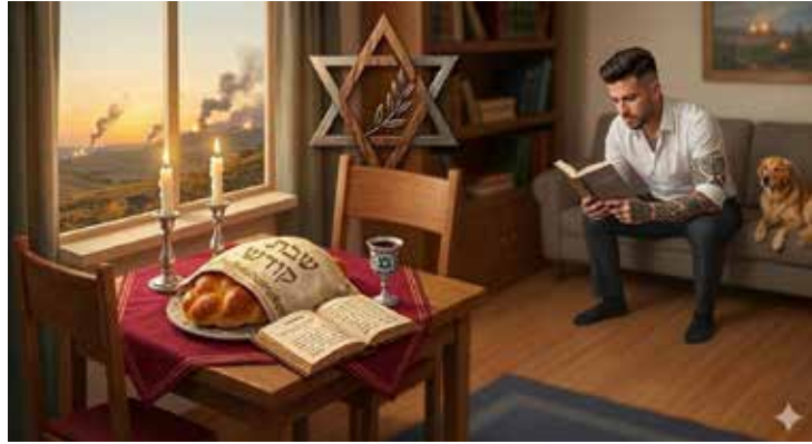
מעבר ממשיח בן יוסף לבן דוד

לו הרב קוק זצ"ל היה פועל עמנו היום, ברור מעל לכל ספק שמוקד קריאתו היה משתנה בהתאם לתקופה. בשעתו, פעל הרב כדי לעורר את עם ישראל לעלות מהגלות ארצה ולבנות את היישוב ואת קומת החול מתוך חיבור לקודש וקריאה בשם שמיים. היום, לאחר שמדינת ישראל קמה והתבססה חומרית, קריאתו הייתה מופנית אל תנועת