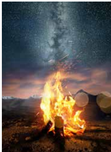
תיקון החברה רק על ידי מוסר אלוקי

ל"ג בעומר מציינ את היום שבו פסקו התלמידים למות, ובמקביל את היולדת רבי שמעון בר יוחאי, שממנו יצאה תורת הסוד. הקשר בין הפסקת המוות לבין תורת הסוד אינו מקרי, אלא מהותי; תורת הסוד והפנימיות היא זו שמלמדת אותנו להתבונן לעומק הנשמה, שם טמון המקור לכבוד אמיתי ולאהבת חיים. מכאן עולה השאלה שבה דנו רבים מאנשי החינוך: מהי התרופה לאלמות ולמידות הרעות? התשובה טמונה בתורה עצמה. הציווי "אהבת לרעך כמוך" אינו עומד לבדו; הוא מסתיים במילים "אני ה'". הקדוש ברוך הוא מקור