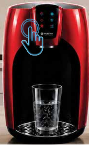
בר מים טאץ' מים חמים וקרים ממשק טאץ' חכם