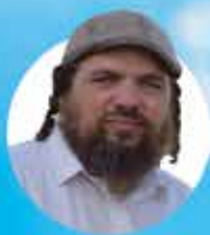
סיפורי מעשיות עם עצות לחיים טובים שאולי חיון