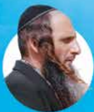
לומדים התבודדות הרב מאור קריו

ימים א'-ה' בשעה 8:30/9:00 בבוקר | פתוח לכולם ללא עלות