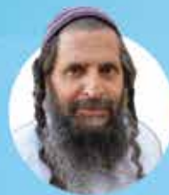
מוחין דגולות בספרי רבי נחמן הרב נתן כהן