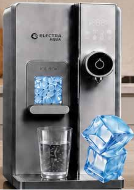
בר מים וקרח AQUA מים חמים וקרים וקוביות קרח

מים מסוננים וטעימים בעיצובים שמוסיפים סטייל לכל מטבח