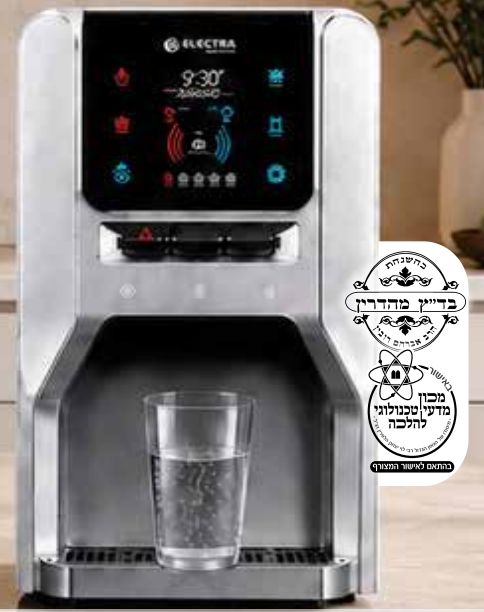
בר מים שבת מים חמים וקרים מסך דיגיטלי עם כפתורים מכאניים