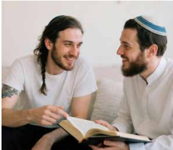
להבין את התרבות העושקת את הנשמה

מצוות "ואהבת לרעך כמוך, אני ה'" היא מאבני היסוד של היהדות וכלל גדול בתורה. התורה מצווה עלינו לאהוב כל יהודי ויהודי, מתוך הבנה עמוקה שכל אחד מאיתנו הוא בנו של אברהם, יצחק ויעקב, ונושא בתוכו נשמה אלוקית קדושה. אולם, בעת הנוכחית מתפתחת טעות חמורה בקרב רבים, המבלבלים בין האהבה ליהודי לבין קבלה או הכשרה של התרבות שבה הוא חי. העובדה שליהודי יש נשמה קדושה אינה הופכת את התרבות הסובבת אותו לטובה או לנכונה. רבים, ובתוכם גם אנשים מן המגזר הדתי, נופלים למלכודת הזו וסבורים כי מתוך אהבת ישראל עלינו "ללקט ניצוצות" מן התרבות המערבית העכשווית, ובכך הם מאפשרים לה להשפיע עליהם ולטשטש את הגבולות הברורים של האמת.