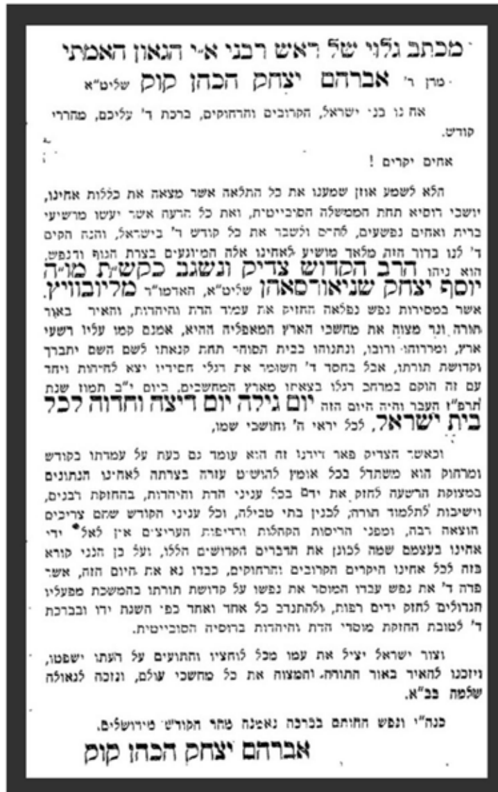
לשנה אחרת קבעום ועשאום ימים טובים. קריאתו של הרב קוק זצ"ל לציון חגיגת גאולתו של הרבי הרי"צ, בשנת תרפ"ח

ידעו נא כל העמים אשר על פני האדמה, כי רק גופותינו נמסרו